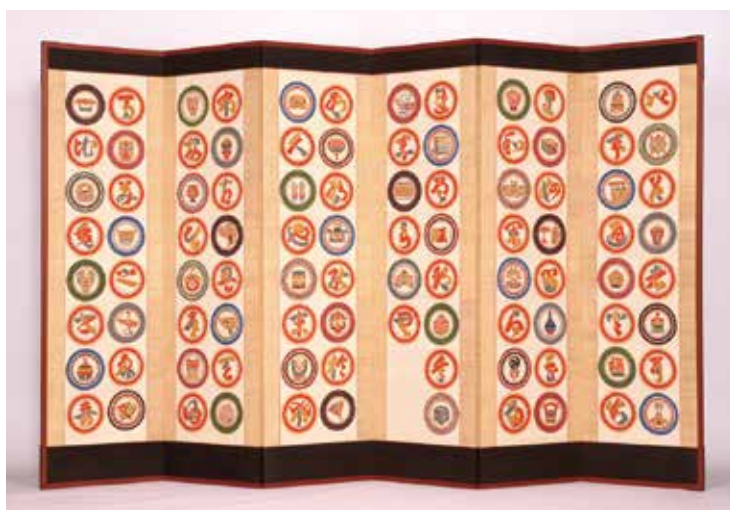
丸紋いろは六曲屏風(1960年)