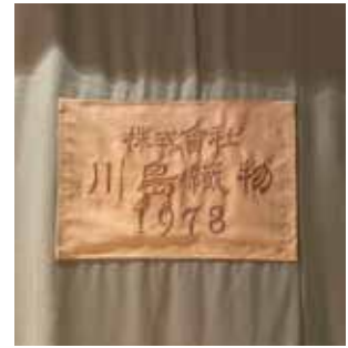
港北公会堂の緞帳裏に縫い付けられたタグ