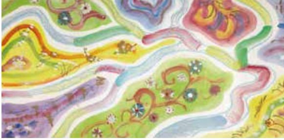
写真10 芹沢銈介が描いた4枚の原画