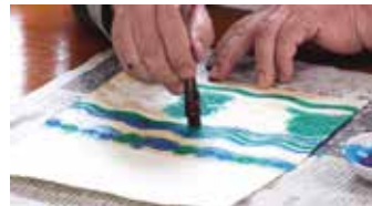
④糊が乾いたら顔料で色を差し、水洗いして糊を落として完成