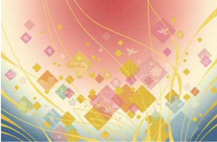
「ゆめの花を咲かせて」と名付けられた新しい緞帳のデザイン