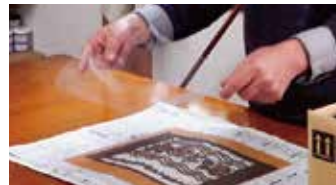
②「紗(しゃ)」と呼ばれる布を貼る