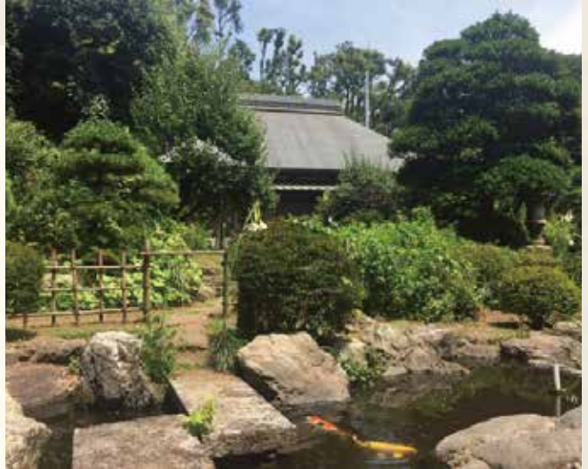
日吉の森庭園美術館

田邊家は、下田町に江戸時代から続く旧家です。現在では財団を設立し周囲の環境を守る活動に従事すると同時に敷地を美術館として公開し、地域の人々に広く愛される場となっています。そんな田邊家と日吉の森庭園美術館についてご紹介します。