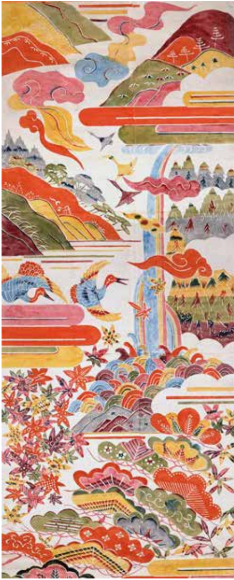
知恩院御影堂内陣荘厳布柱巻 静岡市立芹沢銈介美術館蔵

になることを夢見て、水彩画などを描いていたそうです。家業が傾いたこともあって東京高等工業学校の図案科に進み、卒業後にデザイナーとして工業図案の仕事などを手がけていましたが、いつも傍にはスケッチブックを携え、気になるものを見つけては、写生をしていたといえます。型染の仕事を中心にするまではさまざまな創作活動を行い、ろうけつ染に力を注いだ時期があったことも知られています。対象を正確にとらえる能力はこのようなにして身につけられていきました。さまざまな作品を見てみると実物と違わ