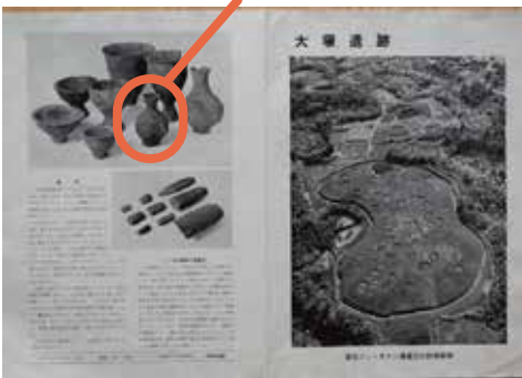
「遺跡」のモチーフと思われる写真を掲載したリーフレット

筑区大棚西に所在する大塚遺跡です。黄色い縁取りは集落をめぐる溝、環濠で、逆S字モチーフの内部の円は半地下式の堅穴住居、小円は屋根を支えた柱穴を表現しています。