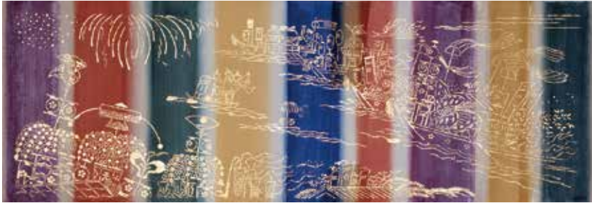
大阪フェスティバルホール「船渡御」下染 静岡市立芹沢銈介美術館蔵

緞帳の仕事は、原案を拡大して制作することから、拡大した際の影響まで考慮に入れなといけません。「陽に萌える丘」の原画からは、拡大した様子を想像して描いているような勢いがうかがえます。また独創的で自由な表現に見えますが、モチーフにした「鶴見川流域絵図」の