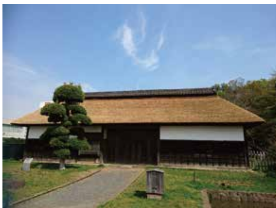
綱島台にある現在の飯田家 長屋門

一方、関わる人間については、治水事業ほど人間の利害、好悪の感情が激しくあらわになるものは少ないように思われる。連帯意識と信頼感をどう高めていくか。川に関わってきた人の思いやりの深さと忍耐力には驚くことが多い。そうした精神が世代を超えて受け継がれていくことを願ってやまない。