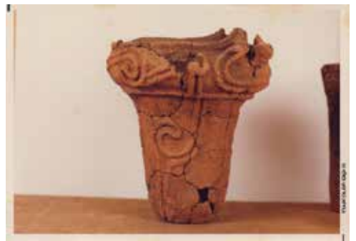
緞帳原画「土器」のモチーフと思われる土器の写真 しかしどこで発見された土器なのか不明

写真には一九七八年撮影とあり、土器は破片を繋ぎ復元され柵に置かれています。さらに右端に見切れるようにもう一点の土器らしき影が確認できます。件の土器は専門性の高い施設に所蔵されているのではないかと考え、横浜市歴史博物館の収蔵庫を探し、(公財)横浜市ふるさと歴史財団埋蔵文化財センターに照会を掛け