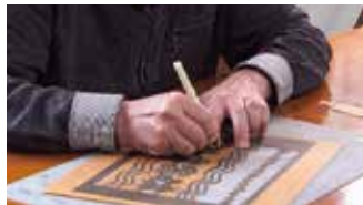
①デザインを型紙に起こし取り切り抜く