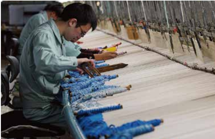
膨大な数の色糸を絵柄に合わせて手作業で織り込んでゆく

らも可能な技術と設備があり、企画・デザイン、設計、製織から、燃糸や染色など、織物を完成させるまでのほぼすべての工程を自社内で行う機能を持っています。