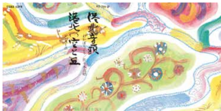
写真8 「港北音頭」と「港北の空と丘」のジャケット 左は、そのジャケットのために芹沢銈介が描いた題字