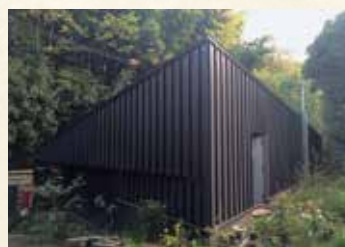
田辺光彰美術館外観（日吉の森美術館内併設）