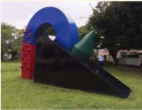
MOMI-1994(2) 野生稲の発芽 1994年制作 ステンレス 神奈川県立翠嵐高校所蔵

日吉の森庭園美術館は、所有する緑地や文化財を活かし、郷土に対する親しみや失われつつある風習・慣習などを海外の異文化と共に展示、研究、保存を行っています。民族の文化や自然への畏敬の念をもって、人間の本質的な豊かさや繋がりを考え、後世に伝えて行きたいと考えています。