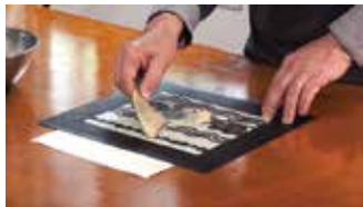
③防染糊を置き染色しない部分を作る