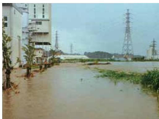
写真11 1976年の水害。右側の鶴見川から堤防を越えて水があふれている