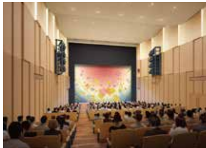
ホール内部の完成イメージ

二〇二四年三月、新綱島駅周辺の再開発ビルの中に、港北区の文化芸術活動の拠点となる港北区民文化センター「ミズキーホール」が開業します。同センターに設置される緞帳の製作は「陽に萌える丘」を手掛けた川島織物セルコンが、デザインも含めて担当しています。ちなみにセンターの愛称「ミズキーホール」は、区民から寄せられた愛称案一五二作品の中から、審査により選ばれた最終候補の四作品に対して区民投票を行った結果決定したものです。