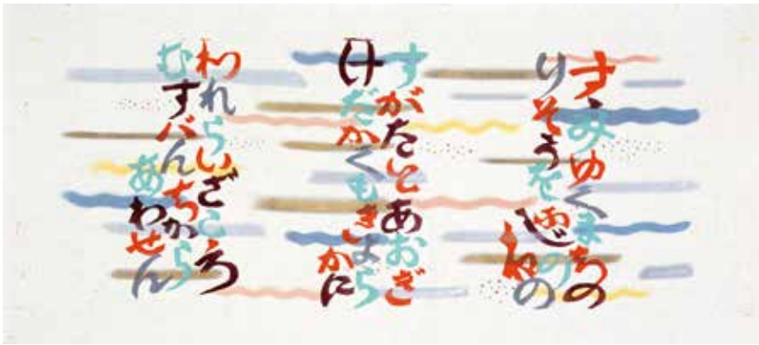
静岡市民文化会館中ホール緞帳原画 静岡市立芹沢銈介美術館蔵

河川の流れる様子も当時の地図の配置を崩さず適切に描写し、そこに住む人たちの想いもきちんと考えていたであろうこと