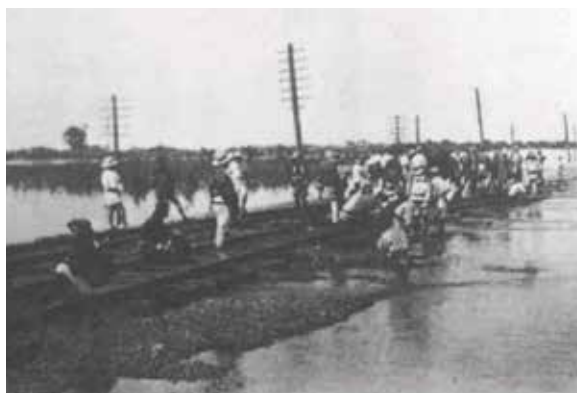
明治43年の水害