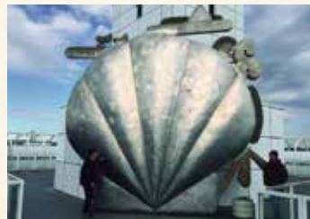
遥かなるもの・横浜「貝」1985-87年制作 ステンレスなど 横浜市本牧埠頭設置

国際的な彫刻家である田辺光彰（1939～2015年）は、田邊泰孝の娘婿です。30年に亘り“農”をテーマとし、とくに現代彫刻による野生稲（日本にはない稲の原種）自生地保全プロジェクトを制作のモチーフにすえ、作品はアジアの稲作地帯、国際的農業研究施設、各国の国立研究所、美術館、博物館、国連機関に収蔵展示されています。田辺光彰美術館では、作品展示およびその制作に大きな影響を与えた収集資料を常設展示しています。