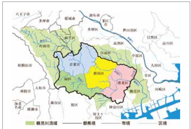
写真6 成立当初の港北区と現在の区域 (NPO 法人鶴見川流域ネットワーク提供のマップに加筆)