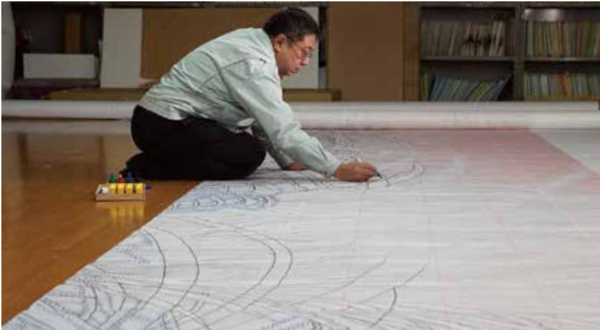
作家が描いた原画をもとに緞帳と同じサイズの下描きを描く作業

つづれ織の緞帳は何本もの糸を撚って作った色糸を、強く張った縦糸に下絵に合わせて一本ずつ織り込んで作られる巨大な織物です。広い舞台に設置する大きなものでは、総重量一トンを超えるものもあります。製作には熟練した技が必要となり、多くの色を使った微妙なグラデーションにより繊細な絵画的な表現が可能な一方、織物独特の目の粗さを活かすことで力強い表現もでき、それ自体が一つの工芸作品と言えます。