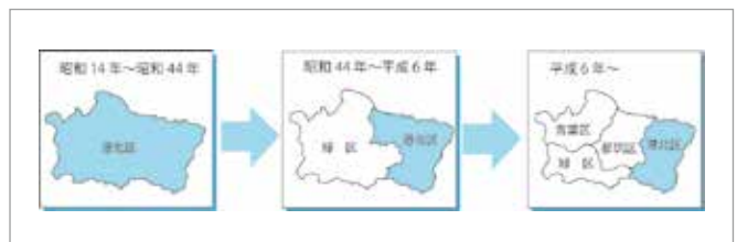
写真7 区域の移り変わり

十三）年ですから、緞帳が作られた昭和五十年代は今と区域が違っていたことを私たちは意識しておく必要があります。その当時まだ開発中だった港北ニュータウンは、今では都筑区になっていますが、当時は港北区に含まれていました。ニュータウン開発に際しては詳細な発掘調査が全域で実施されて、数多くの遺跡が見つかりました。当時の港北区民にとって、緞帳の原画に土器や遺跡を描いた絵があ