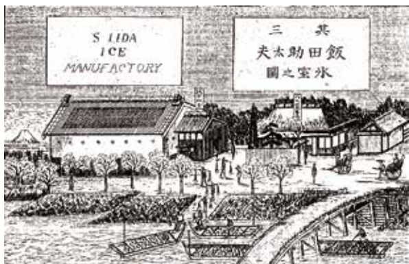
飯田家の氷場で作られた氷は、鶴見川岸にある氷室(左奥の白い壁の建物)に貯蔵され船で横浜へ出荷された。

めている。特に横浜開港後は綱島寄場組合大総代として、近隣数十ヶ村を統括する名主役に任じられている。こうした行政の役割を担う一方、殖産興業を推進した。幕末から明治期にかけてであるが、開港場横浜のし尿処理を一手に引き受け肥料会社を設立して開墾地へ供給した。