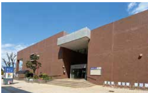
港北区役所に面した港北公会堂の入口

港北公会堂は、東急東横線の大倉山駅を降りて左手、お店が並ぶにぎやかなレモンロードを歩いて約七分、港北区役所に向かい合うかたちで建てられています。区役所とおそろいの赤いレンガの建物の中にある約六〇〇席のホール（正式には「講堂」といいます）では、港北区民によるさまざまなイベント・発表会・企業や団体による式典などが行われています。「公会堂」というのは元々、市民の集いなどを行うための施設です。港北公会堂はまさに、港北区民のための集会場として、幅広い分野の幅広い年齢層の方々に利用されています。 また、建物の二階には約五〇名と八〇名収容の会議室と、和室が一部屋あり、こちらも区民によるサークル活動や生涯学習の教室など幅広く利用されています。