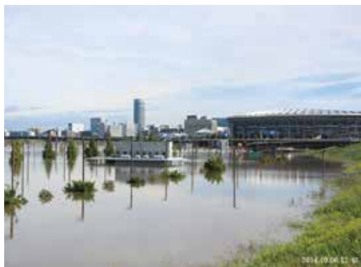
写真12 2014年の台風時 増加した鶴見川の水を一時的に溜め置く多目的遊水地

その後、河川改修が進み、雨水調整池や多目的遊水地なども造られて、鶴見川の安全性は飛躍的に高まりましたが、今も水害の脅威が無くなったわけではありません(写真12)。港北区民文化センターの緞帳(37ページ参照)が、「陽に萌える丘」のイメージとしてデザインされていることは、未来への大切なメッセージだと思います。