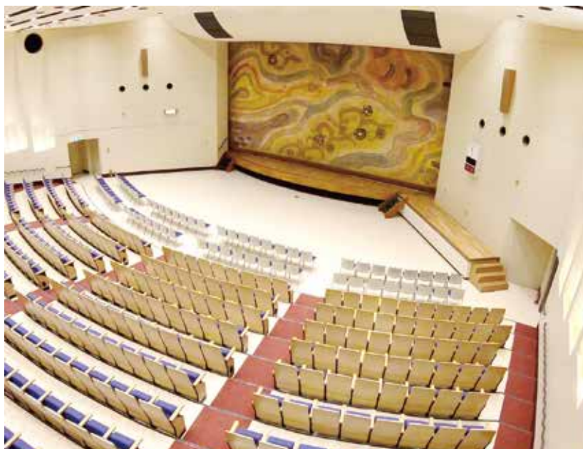
約 600 席の講堂に設置された緞帳

その頃の港北区は人口が急増し、小学校が毎年のように新設されたほど。それまでの木々が生い茂る丘陵地帯の中に広い農地が広がる風景が、ビルや住宅、工場などが林立