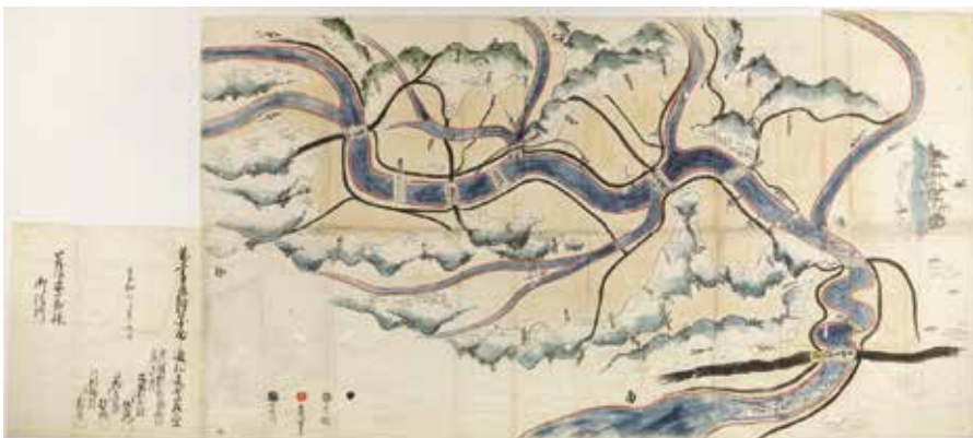
池谷家に保管されている「鶴見川流域絵図」

す。舟による輸送は、江戸時代には幕府へ納める年貢米が主でした。その後、明治になり横浜が開港し、人口が増え、東京・横浜という都市が栄えた以降は、そうした大消費地への農産物・レンガ・綱島の天然水など地域産品の運び出しです。逆に川を上る舟では、都市で出た屎尿を運び、農作物の肥料にするということも行われていました。