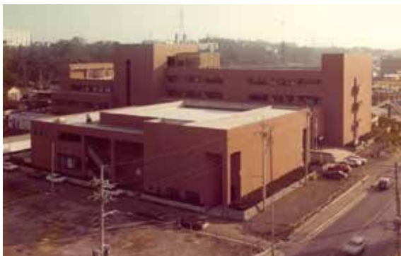
完成当時の港北公会堂(手前)と港北区役所(奥)

建設されたのは、一九七八（昭和五十三年）年。区役所が、菊名（現在の港北図書館）から移転するのに伴い、それまで庁舎内にあった公会堂が区役所の隣に別棟として建てられました。昭和五十三年というと、昭和三十年代からの高度経済成長とその後のオイルショックが一段落し、安定的な経済成長がはじまりつつあったころ。日本が家電・自動車・半導体などのテクノロジー産業で世界に躍進をはじめ、国際社会での存在感を拡大させていった時期でもあります。この年の五月には海外渡航の増加を見据え成田空港が開港しました。