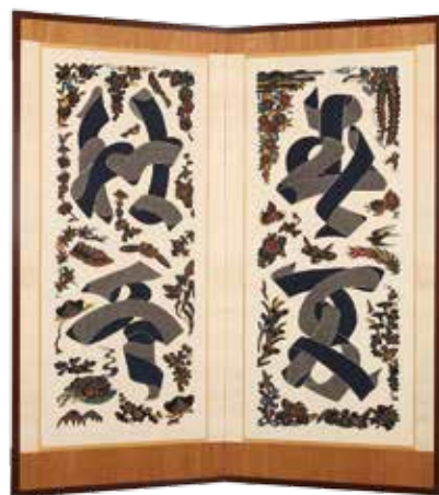
布文字春夏秋冬二曲屏風(1965年)